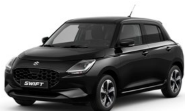
T Super Black pearl metallic (ZMV)