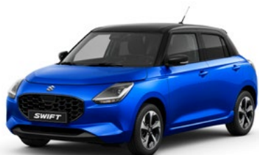
T Frontier Blue pearl metallic / Super Black pearl metallic (E6L)