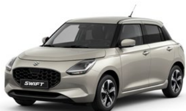
T Caravan Ivory pearl metallic (ZYL)