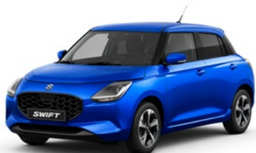
T Frontier Blue pearl metallic (WB1)