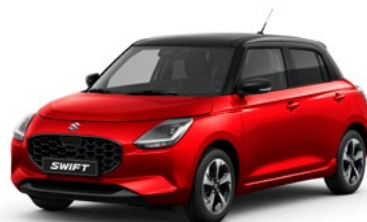
T Burning Red pearl metallic / Super Black pearl metallic (D7Z)