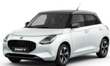
T Pure White pearl metallic / Mineral Gray metallic (DYH)