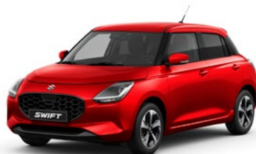
T Burning Red pearl metallic (ZWP)