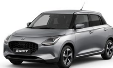
T Premium Silver metallic (ZNC)