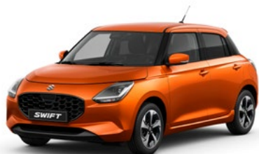
S Flame Orange pearl metallic (ZWD)