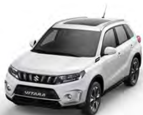
S White solid (26U)