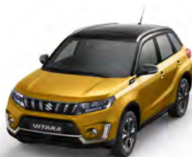
T Solar Yellow pearl metallic (DBH)