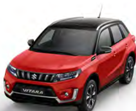
T Bright Red 5 solid (A9H)