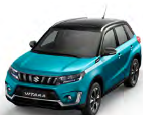
T Atlantis Turquoise metallic (A9L)