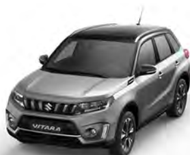
T Galactic Gray metallic (A9G)