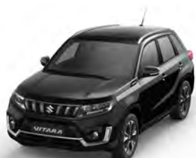
T Cosmic Black pearl metallic (ZCE)