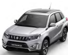
T Silky Silver 2 metallic (ZCC)