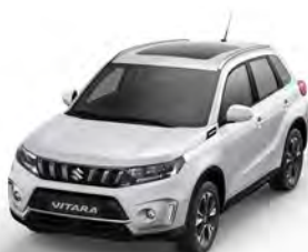
T Cool White pearl (ZNL)