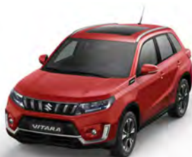
S Bright Red 5 solid (ZCF)