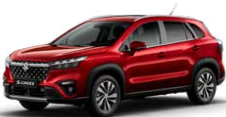
T Energetic Red pearl metallic (ZQ5)