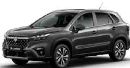
T Titan Dark Gray pearl metallic (ZZZ)