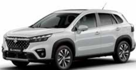
T Cool White pearl metallic (ZNL)