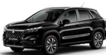
T Cosmic Black pearl metallic (ZCE)