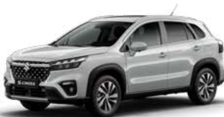
T Silky Silver metallic 2 (ZCC)