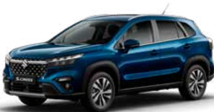
T Sapphire Blue pearl metallic (ZQ4)