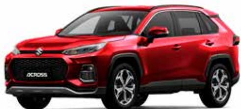
T Sensual Red Mica pearl metallic (3T3)