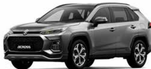
T Gray Metallic metallic (1G3)