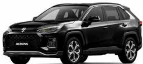
T Attitude Black Mica metallic (218)