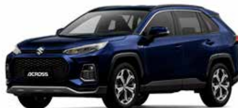
T Dark Blue Mica metallic (8X8)