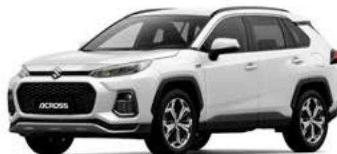
T Platinum White pearl metallic (089)