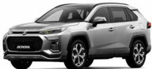
S Silver Metallic metallic (1D6)