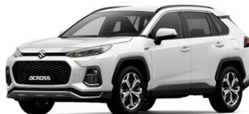
T Platinum White pearl metallic (089)