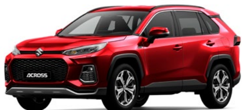
T Sensual Red Mica pearl metallic (3T3)