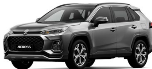
T Gray Metallic metallic (1G3)