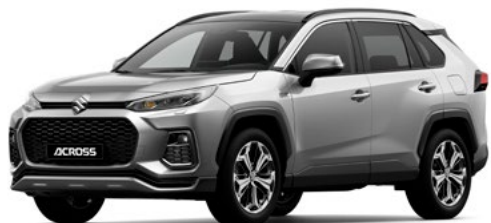
S Silver Metallic metallic (1D6)