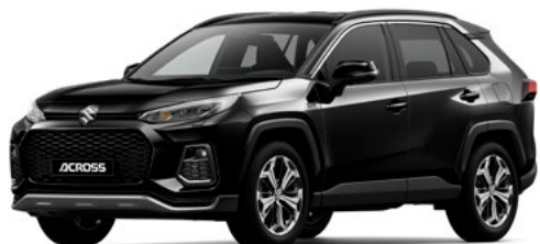
T Attitude Black Mica metallic (218)