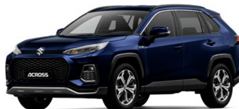
T Dark Blue Mica metallic (8X8)